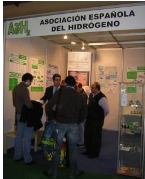
Stand de la AeH 2 en GENERA 2008

Las actividades de difusión son claves para la consecución de dicho objetivo, y por ello la AeH 2 participa periódicamente en ferias de energía, nacionales e internacionales, en las que se explica a todos los interesados aspectos técnicos sobre el hidrógeno y las pilas de combustible, y aspectos específicos de la AeH 2 , como sus principales objetivos, entidades participantes y las actividades que desarrolla.