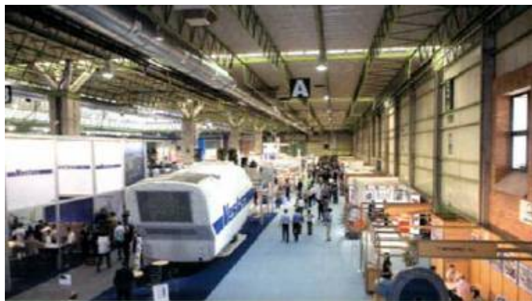
POWEREXPO en la edición de 2006

Si desea ampliar la información sobre la Feria visite su propia página web en: www.feriazaragoza.com/web/home/home_certamen.asp?idioma=es&id=16 .