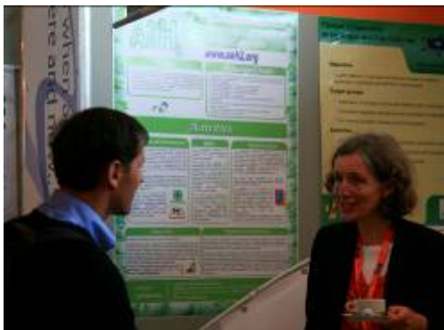
La AeH 2 como co-expositor en HANOVER 2008