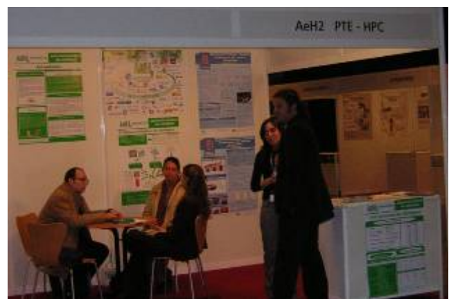
Stand de la AeH 2 en el pmH 2 2007